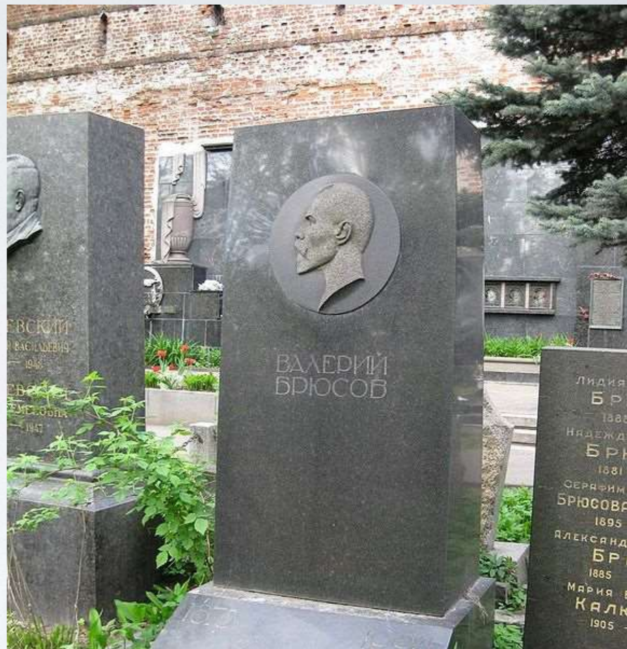
Могила Брюсова на Новодевичьем кладбище.

9 октября 1924 года Брюсов скончался в своей московской квартире от крупозного воспаления лёгких . Поэт был похоронен на СТОЛИЧНОМ Новодевичьем кладбище .