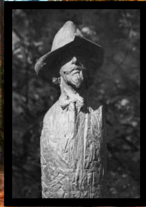
Памятник Бальмонту в Вильнюсе

С 1905 года Константин Бальмонт активно участвовал в политической жизни страны, сотрудничал с антиправительственными изданиями. Через год он, опасаясь ареста, эмигрировал во Францию, считая себя политическим эмигрантом. В этот период Бальмонт много путешествовал и писал, выпустил книгу «Песни мстителя». Он обосновался в тихом парижском квартале Пасси, но большую часть времени проводил в дальних разъездах. Почти сразу же он ощутил острую тоску по родине. Вопреки сложившемуся представлению, страхи поэта перед возможным преследованием российских властей не были бесосновательными. Исследования материалов, касающихся «революционной деятельности» К. Бальмонта, дают понять, что власти «считали поэта опасным политическим лицом» и негласный надзор за ним сохранялся даже за границей. Поэт вернулся в Россию в 1913 году, когда была объявлена амнистия в честь 300-летия дома Романовых. Октябрьскую революцию 1917 года поэт не принял, в книге «Революционер я или нет?» он рассуждал о том, что поэт должен быть вне партий, однако выражал негативное отношение к большевикам. В это время Бальмонт был женат уже в третий раз — на Елене Цветковской.