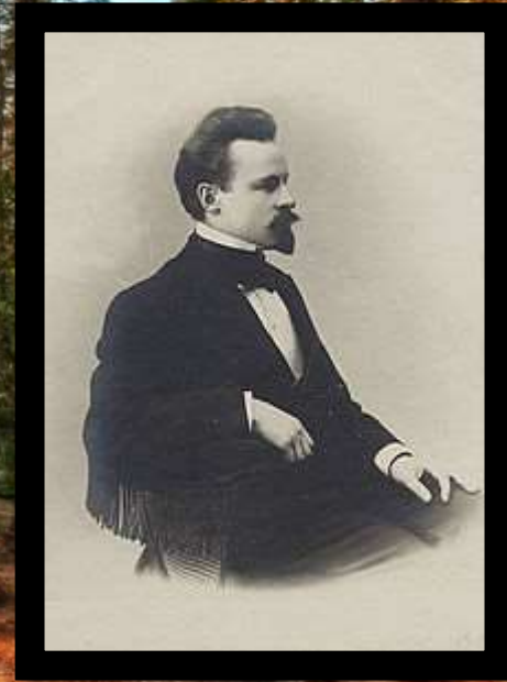
Бальмонт в 1880-е годы

Из седьмого класса в 1884 году Бальмонт вынужден был уйти из-за принадлежности к нелегальному кружку, который занимался тем, что печатал и распространял в Шуе прокламации исполнительного комитета партии «Народная воля». Подоплёку этого своего раннего революционного настроения поэт впоследствии объяснял так: «...Я был счастлив, и мне хотелось, чтобы всем было так же хорошо. Мне казалось, что, если хорошо лишь мне и немногим, это безобразно». Усилиями матери Бальмонт был переведён в гимназию города Владимир. В конце 1885 года состоялся литературный дебют Бальмонта. Три его стихотворения были напечатаны в популярном петербургском журнале «Живописное обозрение». Курс Бальмонт окончил в 1886 году, по собственным словам, «прожив, как в тюрьме, полтора года». «Гимназию проклиная всеми силами. Она надолго изуродовала мою нервную систему», — писал впоследствии поэт. В 1886 году Константин Бальмонт поступил на юридический факультет Московского университета, но уже в 1887 году за участие в беспорядках, Бальмонт был исключён, арестован и посажен на трое суток в Бутырскую тюрьму, а затем без суда выслан в Шую. Бальмонт до конца своей жизни считал себя революционером и бунтарём, мечтавшим «о воплощении человеческого счастья на земле».