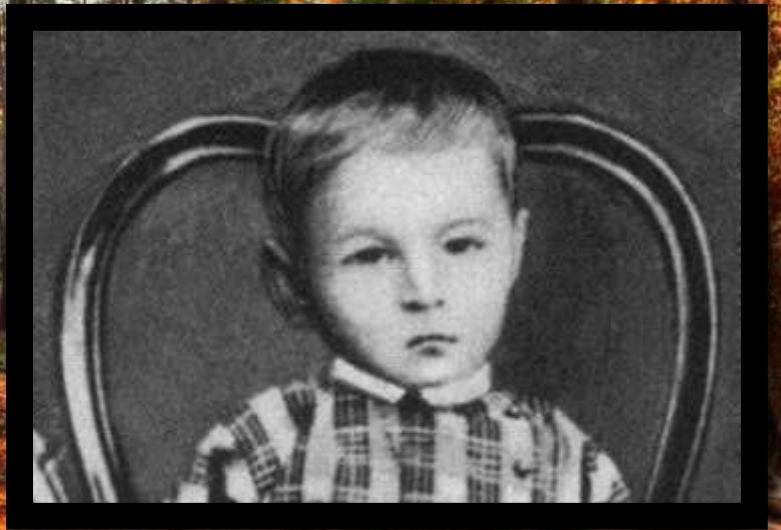
Поэт в детстве

Когда пришло время отдавать старших детей в школу, семья переехала в Шую. В 1876 году Бальмонт поступил в подготовительный класс Шуйской гимназии, которую позже называл «гнездом декадентства и капиталистов, чьи фабрики портили воздух и воду в реке». Сначала мальчик делал успехи, но вскоре ученье ему наскучило, и успеваемость снизилась, зато наступило время запойного чтения, причём французские и немецкие произведения он читал в подлиннике. Под впечатлением от прочитанного он в возрасте десяти лет сам начал писать стихи. «В яркий солнечный день они возникли, сразу два стихотворения, одно о зиме, другое о лете», — вспоминал он. Эти поэтические начинания, однако, были раскритикованы матерью, и мальчик не пытался повторить свой поэтический эксперимент в течение шести лет.